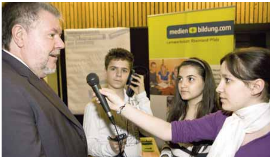
Vor der Diskussion stand der Ministerpräsident jungen Radioreporterinnen Rede und Antwort.