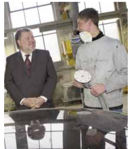
Nah bei den Menschen: Kurt Beck in einem Ausbildungsbetrieb.

Neben der Bildungspolitik stand hier vor allem die Integration im Mittelpunkt. Ministerpräsident Beck appellierte an die Jugendlichen, sich nicht gegenseitig auszugrenzen. Das gelte im Alltag aber auch in der Diskussion um die Realschule plus. Kritik übte er an der ablehnenden Haltung von Realschülern gegen die Hauptschüler: Diese „Aus- und Abgrenzung“ dürfe nicht sein – schließlich wollten die Realschüler auch nicht von Gymnasiasten abgegrenzt werden. Der Ministerpräsident forderte die Jugendlichen auf, untereinander mehr Solidarität zu zeigen.