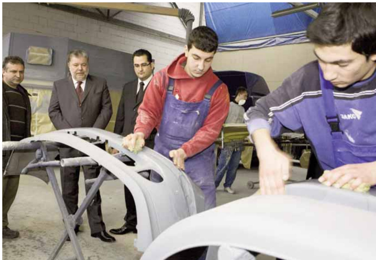
Eine Autolackiererei eines türkischen Unternehmers, der Jugendliche mit Migrationshintergrund ausbildet, war eines der Besuchsziele von Ministerpräsident Kurt Beck in Ludwigshafen. Das Unternehmen arbeitet in dem Projekt IDA mit, das landesweit beispielhaft für die Integration steht.

Ausgabe B Postvertriebsstück · Entgelt bezahlt · G 6659 Oppenheimer Druckhaus GmbH 55232 Alzey