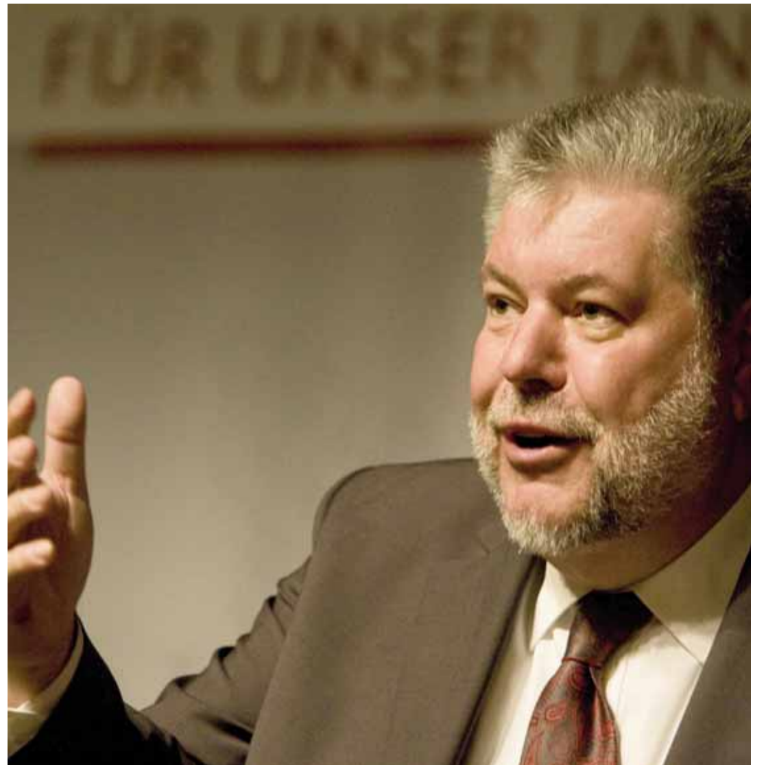
Ministerpräsident Beck erwies sich als aufmerksamer Zuhörer und Diskutant.