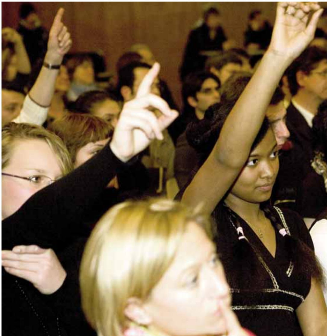
Großes Interesse herrschte bei den Jugendlichen an den Themen der Podiumsdiskussion.