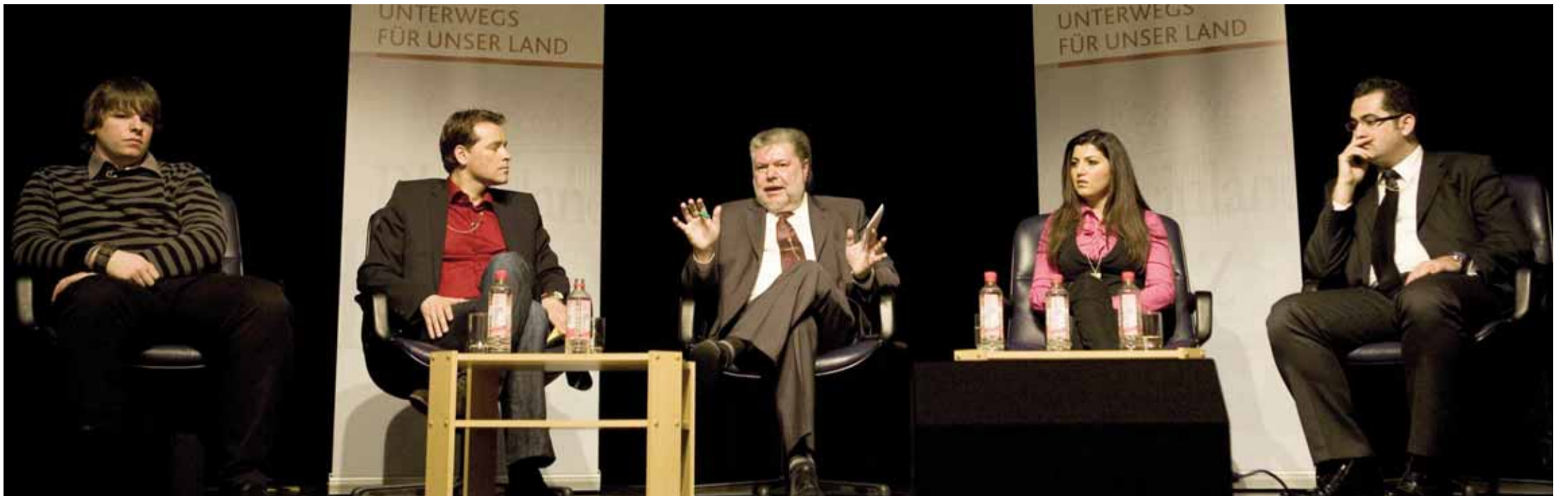
„Zukunft braucht Jugend – Jugend braucht Zukunft“ war das Motto der Podiumsdiskussion im Kulturzentrum „dasHaus“ in Ludwigshafen.